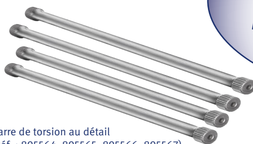
Barre de torsion au détail (Réf. : 895564, 895565, 895566, 895567)