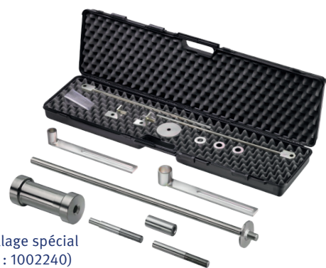
Outillage spécial (Réf. : 1002240)