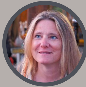
Emmanuelle Carrosserie Gresset

« Plus de perte de photos, de temps inutile à archiver l'album ni pour alimenter les EAD de clichés. Tout se fait automatiquement, un vrai bonheur. A peine utilisé et adopté, foncez et équipez vous rapidement. »