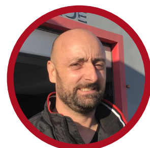
Carmine Carrosserie Ghigo

« Une meilleure fluidité de la prise de photos. »